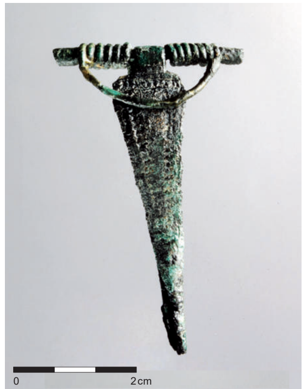
Abb. 1 | Niemberger Fibel aus der Gemarkung Schlettwein.

Während der Römischen Kaiserzeit (0–375 u. Z.) und der Völkerwanderungszeit (375–565 u. Z.)