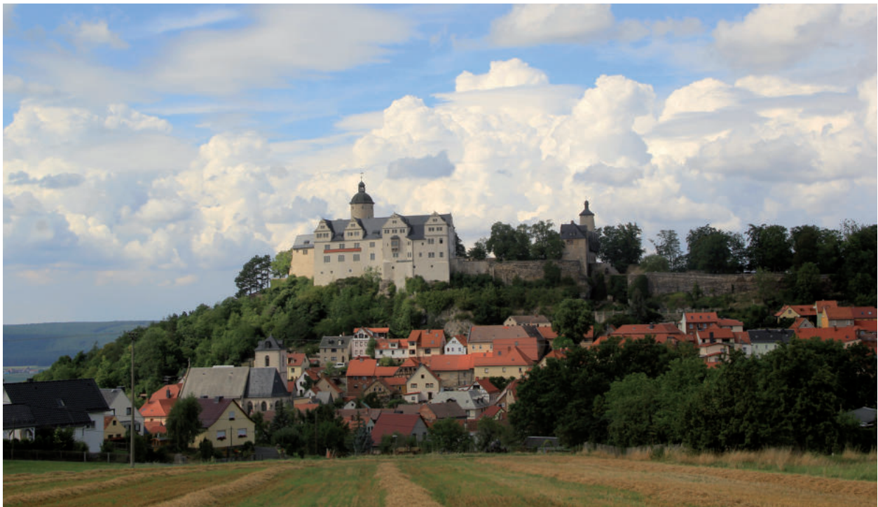
Abb. 2 | Die Südensicht der Burg Ranis.

1199 belehnte der staufische König Philipp von Schwaben den Thüringischen Landgrafen Hermann I. mit Saalfeld, dem Orlagebiet und der Burg Ranis (DOBENECKER 1900, Nr. 1099). Dementsprechend dürfte Ranis zu den Reichsgütern gehört haben, die der welfische König Otto IV. zusammen mit der Stadt Saalfeld 1208/1209 den Brüdern Graf Heinrich II. von Schwarzburg und Graf Günther III. von Käfernburg verpfändete. Wenig später, wohl um 1214, wurde es vom staufischen König Friedrich II. als Reichslehen an die Brüder übertragen (GOCKEL 2000, S. 517). Die Schwarzburger behielten das Gebiet bis 1389. Im selben Jahr verkaufte Graf Günther XXVIII. die Burg an die Markgrafen von Meißen (HERRMANN 1919, S. 10–15), diese wiederum veräußerten sie im Jahr 1430 an die Wettiner. In wettinischer Zeit, unter Herzog Wilhelm III. von Sachsen, wurden größere Baumaßnahmen in Angriff genommen. Im Jahr 1465 schenkte Herzog Wilhelm seinem Schwager Heinrich von Brandenstein die Burg, welche dieser 1571 an die Breitenbauchs (nach 1902 Breitenbuch) verkaufte. Sie blieb bis zur Schenkung der Anlage durch Dietrich von Breitenbuch an das Deutsche Rote Kreuz im Jahr 1945 im Besitz derer von Breitenbuch.